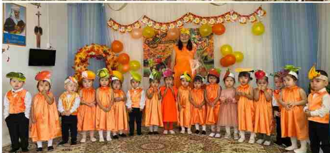
«Гүл» тобының тәрбиешілері «КҮЗ ХАНЗАДАСЫ МЕН ХАНШАЙЫМЫ» атты тақырыбында мерекелік ертеңгілікті сайыс түрінде оздырды.