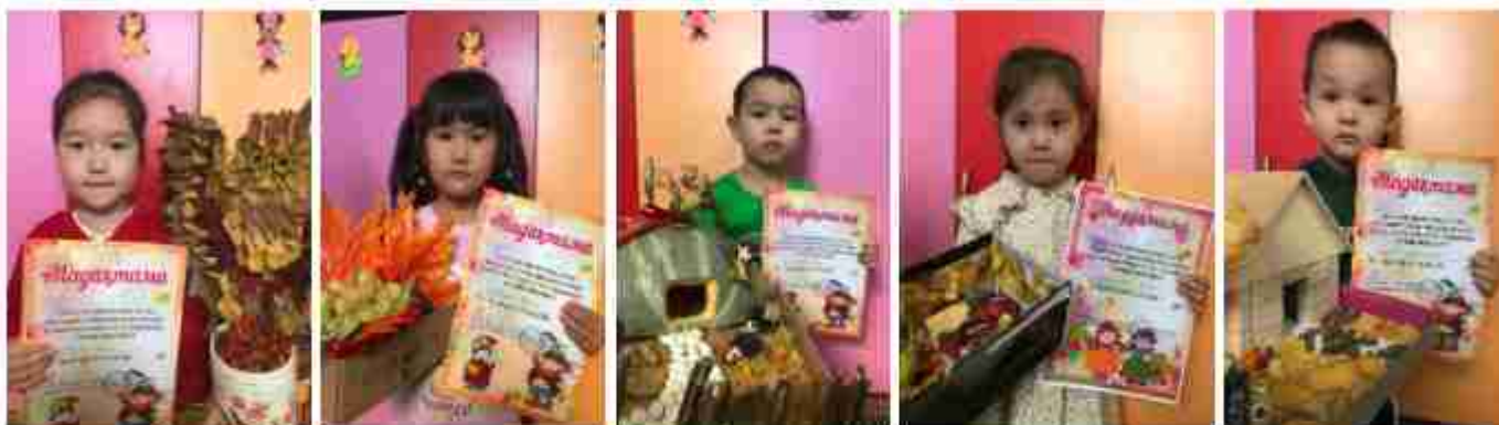
«Ай» тобының тәрбиешісі "Қош келдің Алтын күз" атты ертенгілігінде.....